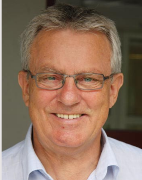
Forbundsleder KNUT MAGNE ELLINGSEN