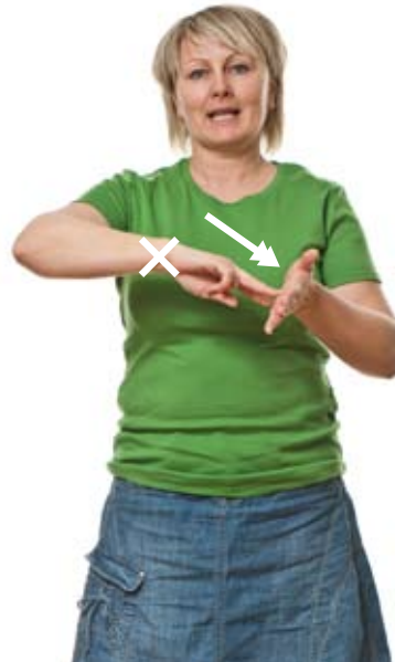
Stilling (Vri i håndleddet)