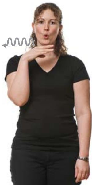
Komedie ( Spillende fingre )