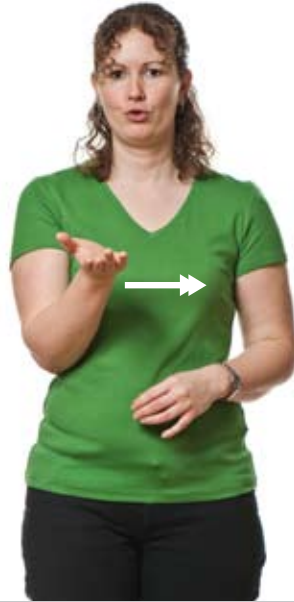
Grill (Roterer vekselvis i håndleddet)