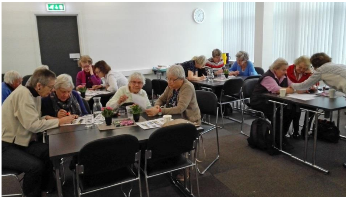
Her er det full konsentrasjon om Formiddagstreffens quiz i januar.

Formiddagstreffensens møter kan, som dere ser av bildet her, være litt av hvert. Noen ganger opplysende, andre ganger underholdende, og noen ganger lager vi all moroa selv.