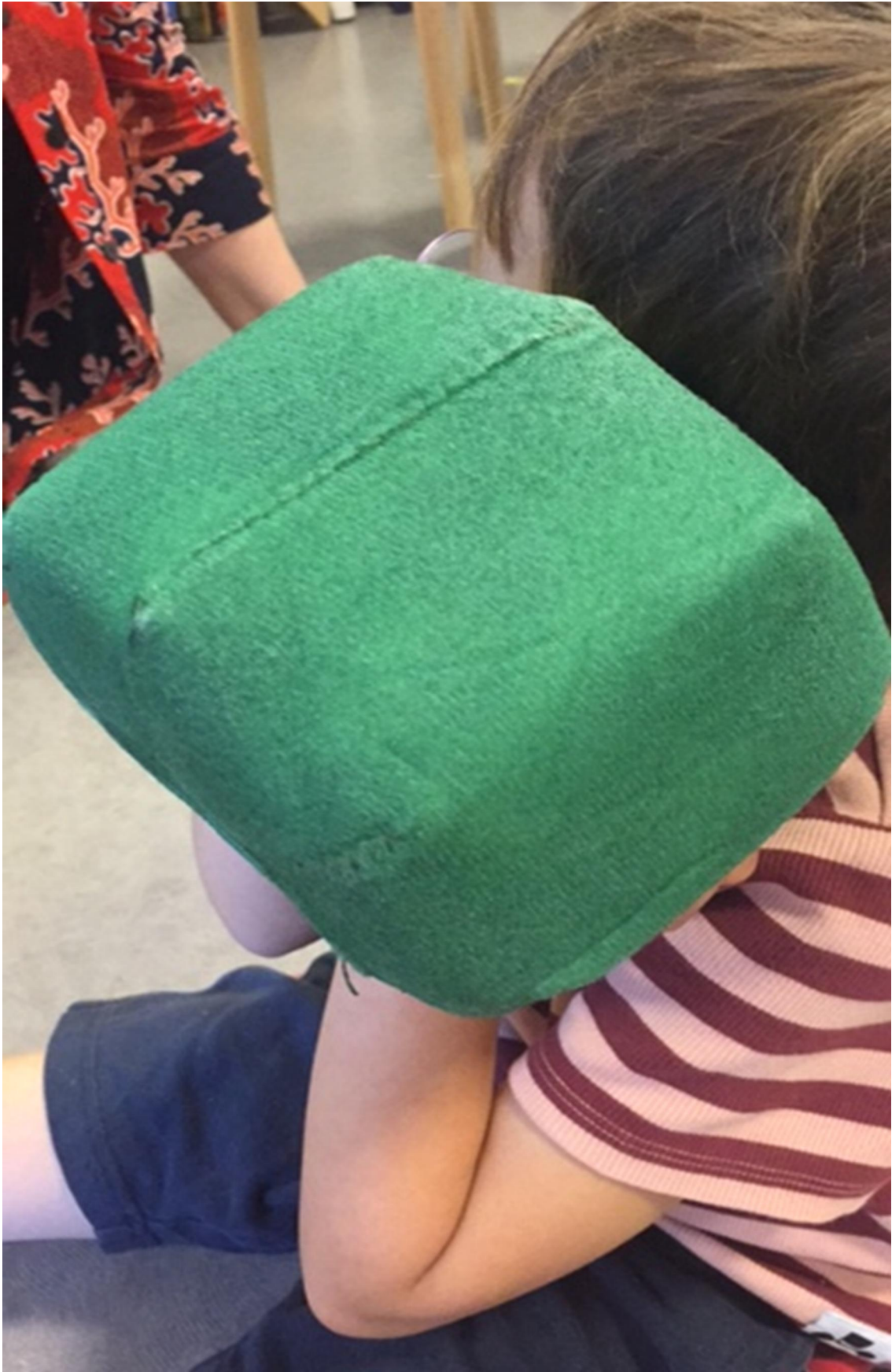
Forprosjekt Voldsløkka barnehage, mai-juni 2018