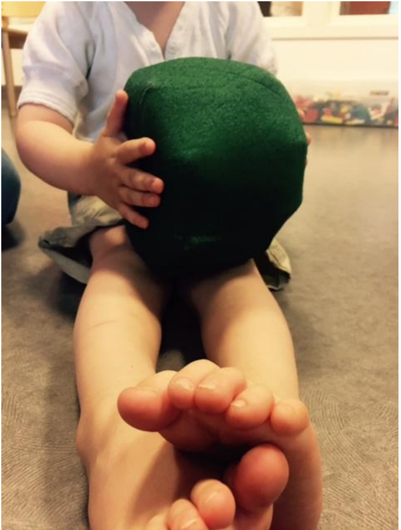
Forprosjekt Voldsløkka barnehage, mai-juni 2018