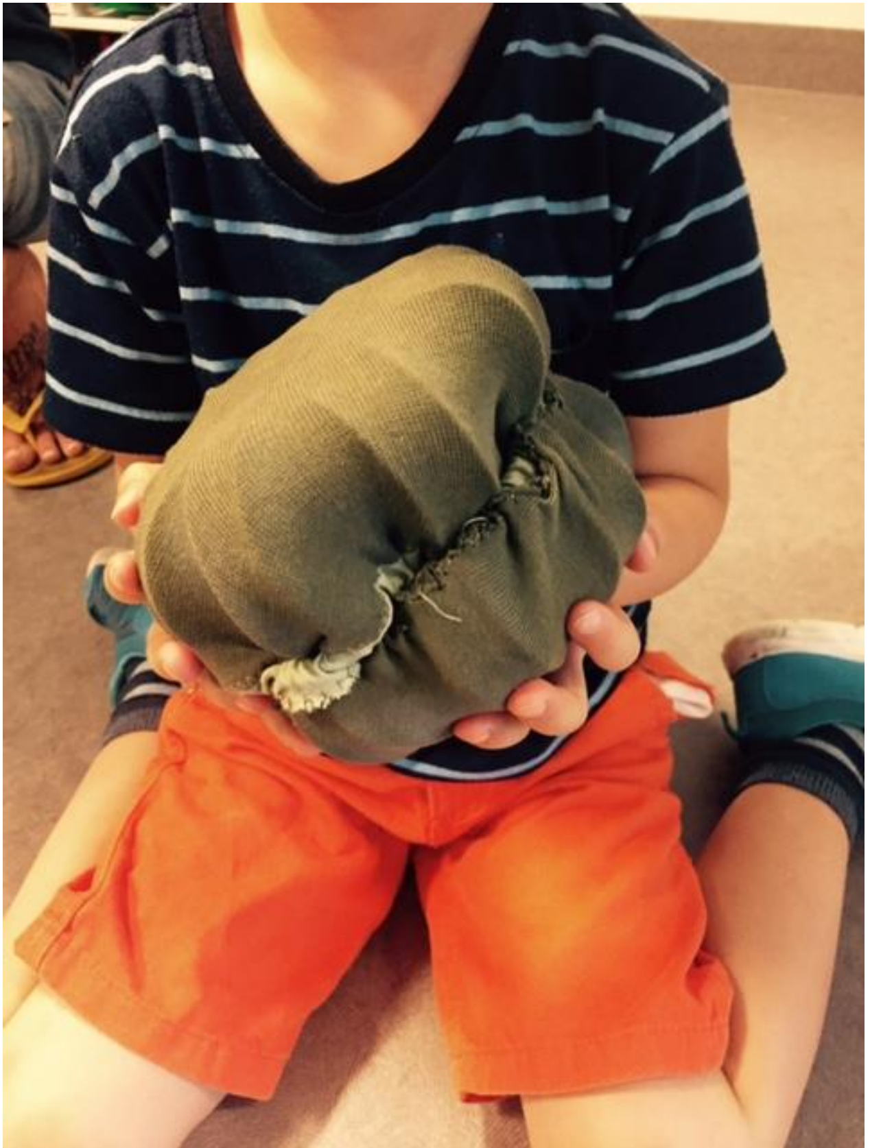
Forprosjekt Voldsløkka barnehage, mai-juni 2018