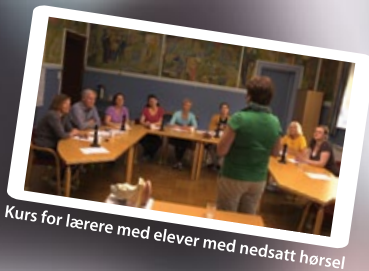
Kurs for lærere med elever med nedsatt hørsel