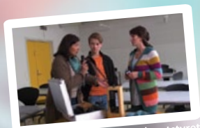
Læreren tester det tekniske utstyret