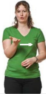
Grill (Roterer vekselvis i håndledet)